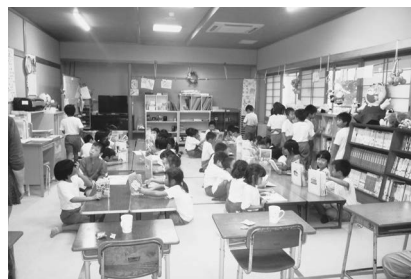
学童保育の子どもたち

「町の学童保育に対する補助は、児童数に応じた基本額に、250日を超えて開所する日数に対する加算、及び長期休暇など1日8時間を超える時間への長時間開所加算がある。昨年度の調査で全国の83・2%が午後6