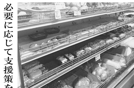
値上げが続く食料品

消費者物価指数は、前年 同月比で3・5%増と高 い上昇率が続いています。 また、帝国データバ ンクの調査では、6月に 1900品目以上の飲食 料品の値上が予定され、 深刻な値上げラッシュが 続きます。