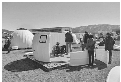
シェルターの組立て(長野の訓練)

町長は「『クラッカーが硬くて食べにくい』とか、段ボール間仕切りは『組み立てるのに時間がかかり耐久性にも欠ける』などの意見があり、備蓄品の整備計画等について調査・研究していく」と答えました。