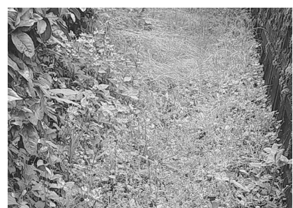
法定外公共物の里道（赤線）

ばれ、道路法、河川法、下水道法、海岸法等の適用または準用がなく、かつ登記上私権が設定されていない公共物です。